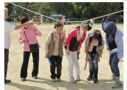
大人も 熱が入ります

『むかで競争』や『三人四脚』など団体競技は、自治会でチームを組み、事前にエントリーしての参加です。今年は、府営住宅自治会、市営住宅自治会、2丁目西住宅自治会の3チームが出場し、競い合いました。