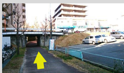
ガードをくぐります