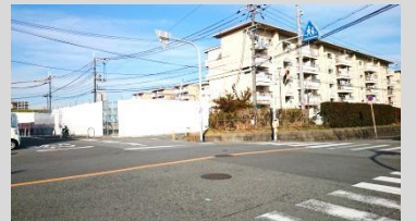
この横断歩道は通りません