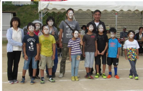
『お化粧競争』今年の特別賞 10名 お化粧上手すぎて どなたなのかわかりません…