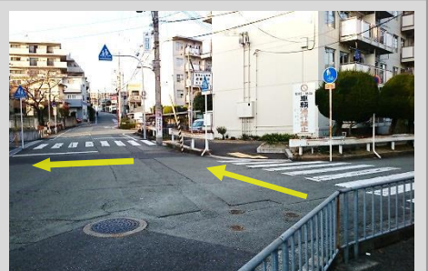
遠回りでも、横断歩道を渡りましょう！（2つ渡る）