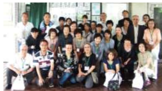
第1回目は7月17日に実施しました。